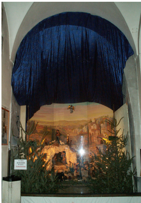
Unsere Krippe vor der Antoniuskapelle