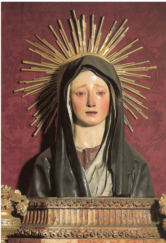
Weinende Madonna, von Pedro de Mena

„...Gott wird alle Tränen von ihren Augen abwischen...“ (Offb 21,3)