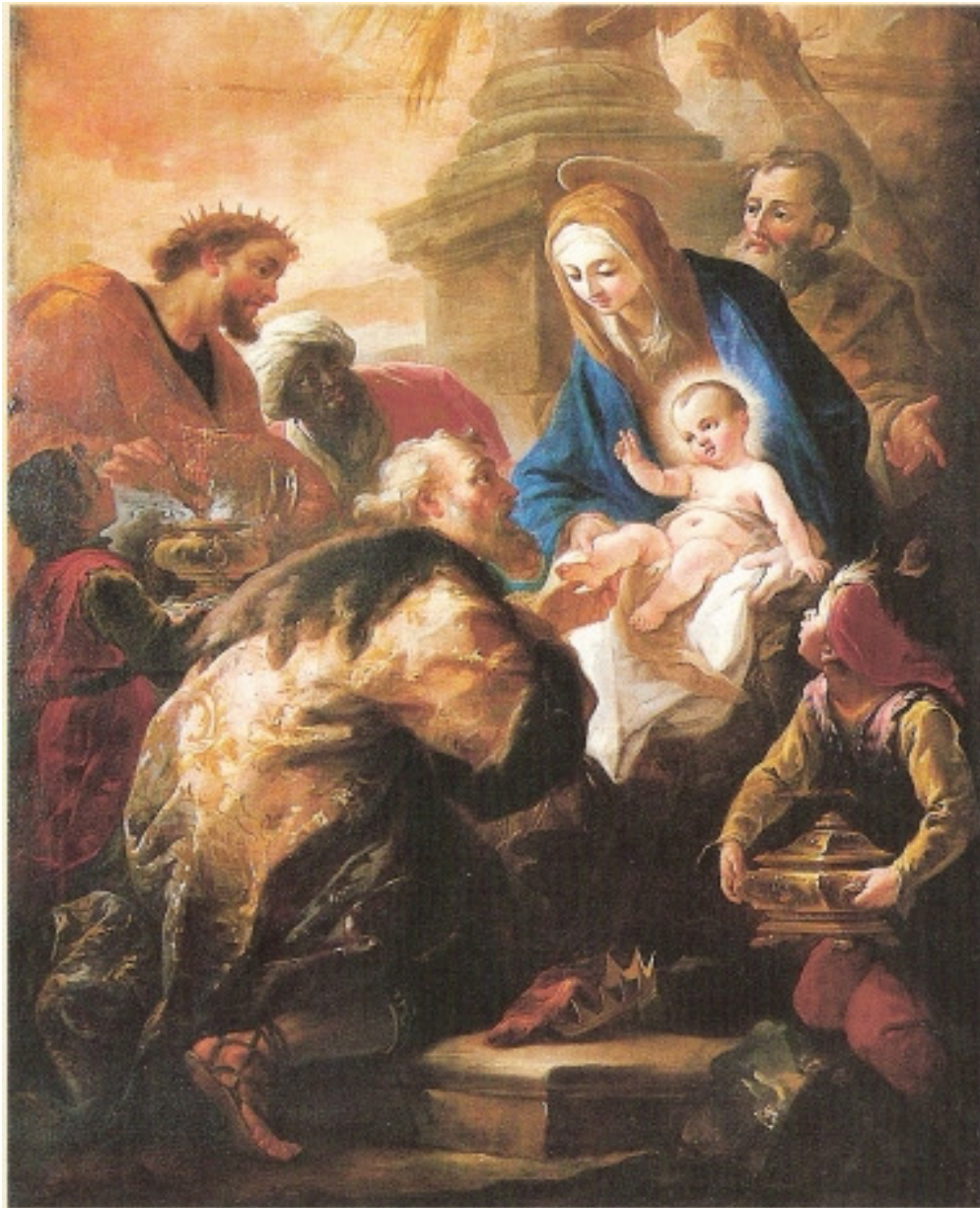
Altarbild "Anbetung der Hl. Drei Könige" Martin Altomonte, 1708

Und das Wort ist Fleisch geworden und hat unter uns gewohnt (Joh 1,14)